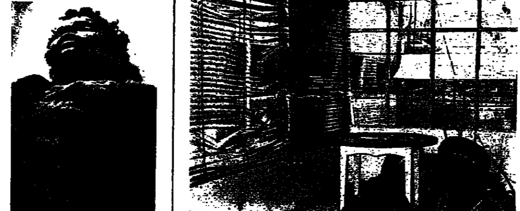
بيت الكنائس في القدس